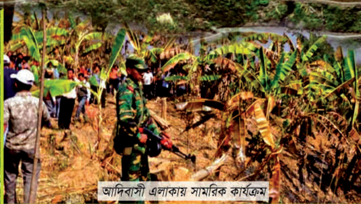
আদিবাসী এলাকায় সামরিক কার্যক্রম

আদিবাসীদের তাদের ঐতিহ্যগতভাবে মালিকানাধীন অথবা ভোগদখলীয় ভূমি, ভূখণ্ড ও সম্পদকে বিভিন্ন উদ্দেশ্যে ভোগ করা, উন্নয়ন করা ও নিয়ন্ত্রণ করার অধিকার রয়েছে। রাষ্ট্র আদিবাসীদের প্রথা, ঐতিহ্য ও ভূমি ব্যবস্থাপনার প্রতি সম্মান প্রদর্শনের মাধ্যমে এই অধিকার অবশ্যই আইনগতভাবে স্বীকৃতি প্রদান ও রক্ষা করবে। এ ধরনের স্বীকৃতি ও সুরক্ষা অবশ্যই একটি নিরপেক্ষ, অবাধ ও স্বচ্ছ প্রক্রিয়া এবং আদিবাসীদের পূর্ণাঙ্গ ও কার্যকর অংশগ্রহণের মাধ্যমে সম্পন্ন করতে হবে। -অনুচ্ছেদ ২৬, ২৭