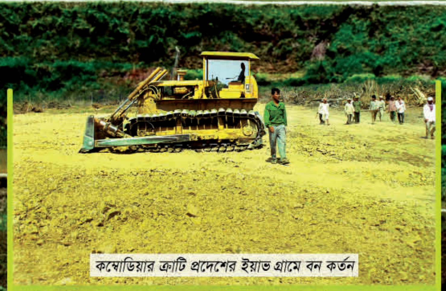
কম্বোডিয়ার ত্রাটি প্রদেশের ইয়াভ গ্রামে বন কর্তন

রাষ্ট্র অবশ্যই নিশ্চিত করবে যে, আদিবাসীদের স্বাধীন ও পূর্বাধিত সম্মতি ব্যতীত তাদের ভূমিতে কোন ক্ষতিকর সামগ্রী স্থাপন বা ফেলে দেয়া হবে না। কোন ক্ষতিকর সামগ্রী দ্বারা ক্ষতিগ্রস্ত হলে, ক্ষতিগ্রস্ত জনগোষ্ঠী কর্তৃক প্রণীত আদিবাসীদের স্বাস্থ্য পরিবীক্ষণ ও পুনরুদ্ধার কর্মসূচি যথা সময়ে বাস্তবায়ন করতে হবে। - অনুচ্ছেদ ২৯