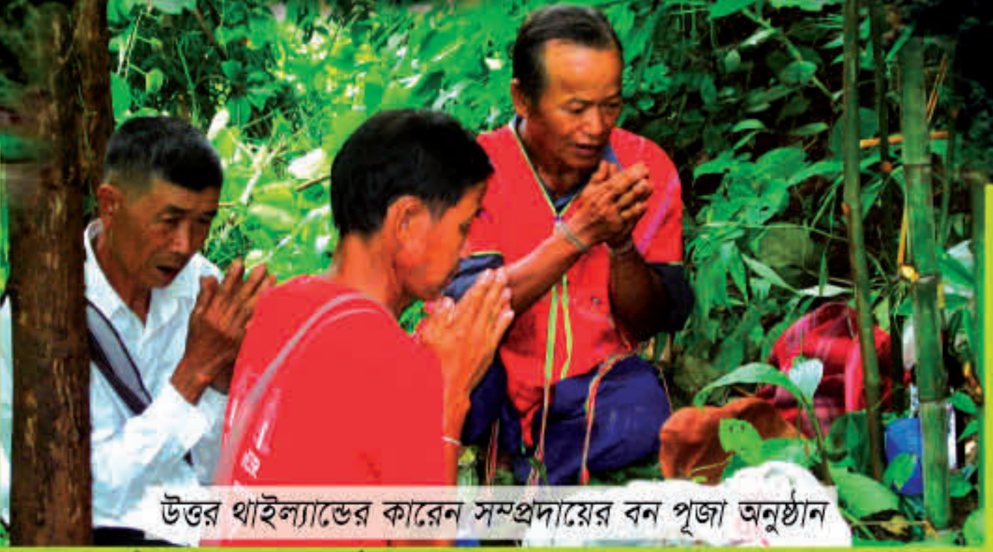
উত্তর থাইল্যান্ডের কারেন সম্প্রদায়ের বন পূজা অনুষ্ঠান

- মাপিখেল বাঁধে ক্ষতিগ্রস্ত নাগা গ্রামবাসী উত্তর-পূর্ব ভারত