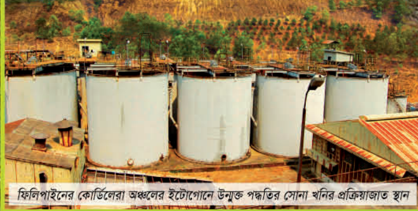
ফিলিপাইনের কোর্ডিলেরা অঞ্চলের ইটোগোনে উনুক পদ্ধতির সোনা খনির প্রক্রিয়াজাত স্থান

আদিবাসীদের পরিবেশ এবং ভূমি, ভূখণ্ড ও সম্পদের উৎপাদনশীলতা সংরক্ষণ ও সুরক্ষা করার অধিকার রয়েছে। রাষ্ট্র এরূপ সংরক্ষণ ও সুরক্ষায় অবশ্যই সহযোগী কর্মসূচি গ্রহণ ও বাস্তবায়ন করবে।