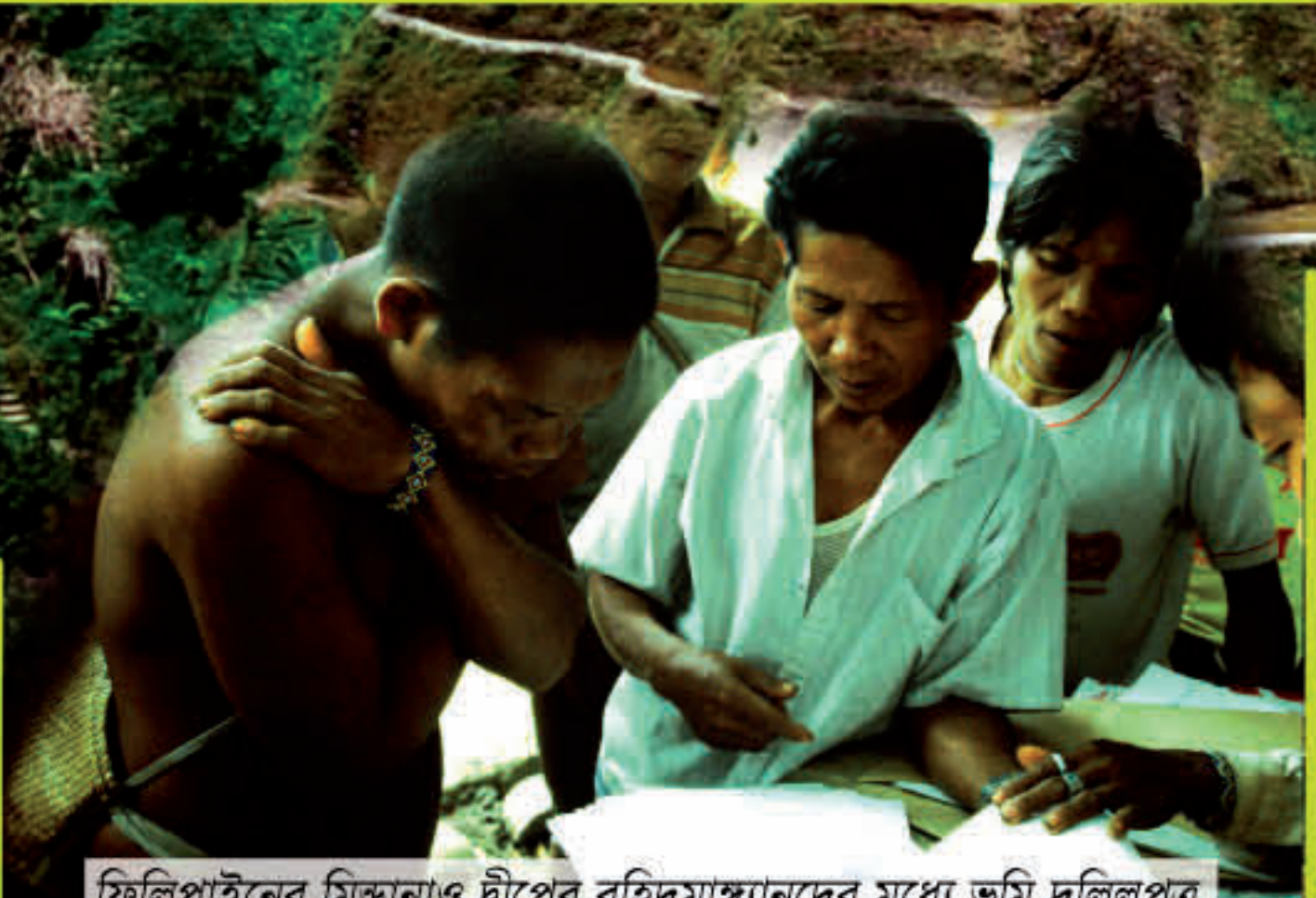
ফিলিপাইনের মিন্দানাও দ্বীপের বুহিদমাঙ্গ্যানদের মধ্যে ভূমি দলিলপত্র

আদিবাসীদের তাদের ভূমি ও ভূখণ্ডের উন্নয়নের জন্য কর্মকৌশল নির্ধারণ করার অধিকার রয়েছে। রাষ্ট্র আদিবাসীদের ভূমি ও সম্পদ, বিশেষ করে খনিজ, জল ও অন্যান্য সম্পদের ব্যবহারের ক্ষেত্রে, কোন প্রকল্প অনুমোদনের পূর্বে অবশ্যই আদিবাসীদের স্বাধীন ও পূর্বাধিত পূর্বক সম্মতি গ্রহণ করবে। রাষ্ট্র এরূপ কর্মকাণ্ডের জন্য প্রতিবিধানমূলক যথাযথ ব্যবস্থা গ্রহণ করবে এবং মারাত্মক পরিবেশগত, অর্থনৈতিক, সামাজিক, সাংস্কৃতিক বা আধ্যাত্মিক প্রভাব হ্রাস করার জন্য যথোপযুক্ত ব্যবস্থা গ্রহণ করবে। - অনুচ্ছেদ ৩২