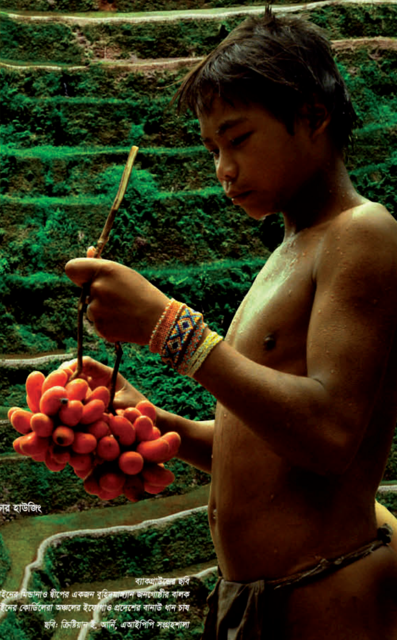
ব্যাকম্যান্ডেলের ছবি ফিলিপাইনের মিন্দানাও দ্বীপের একজন বুহিদমাঙ্গ্যান জনগোষ্ঠীর বালক ফিলিপাইনের কোর্ডিলেরা অঞ্চলের ইটোগোনে প্রদেশের বানউ ধান চাষ

কাপেং ফাউন্ডেশন ২৩/২৫ সালমা গার্ডেন, শেখেরটেক রোড ৪, পিসি কালচার হাউজিং মোহাম্মদপুর, ঢাকা-১২০৭, বাংলাদেশ ফোন : +৮৮০-২-৮১৯০৮১ E-mail: kapaeeng.foundation@gmail.com Web: www.barc-bd.org